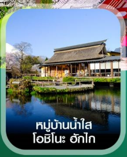
หมู่บ้านน้ำใส โอชิโนะ ฮักไก

คอนเฟิร์ม ออกเดินทาง ทุกพีเรียด 2 ท่านขึ้นไป