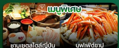
เมนูพิเศษ ชาบูสเตลล์ญี่ปุ่น บุฟเฟ่ต์ชาบู

วัดอาซากุสะ-ถนนนากามิเซะ-พิพิธภัณฑ์แผ่นดินไหว-ไร่ชาโอบุจิ ชะชะบะ-ไดเวอร์ซิตี โอไดบะ-ตลาดปลาชิเกจิ