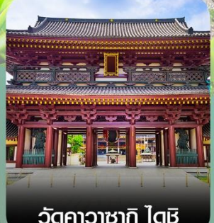
วัดคาวาซากิ ไตจิ