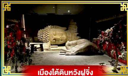
เมืองใต้ดินหวังฝูจิ่ง