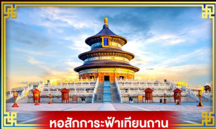
หอสักการะฟ้าเทียนถาน