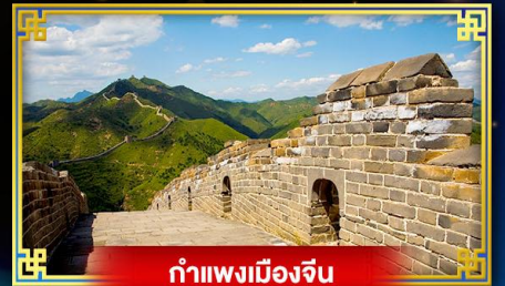
กำแพงเมืองจีน